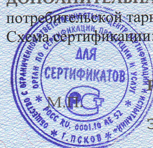
Схема сертификации: 3.

ДОПОЛНИТЕЛЬНАЯ ИНФОРМАЦИЯ Место нанесения знака соответствия: на этикетке потребительской тары, на сопроводительной документации.